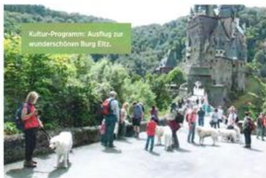
Kultur-Programm: Ausflug zur wunderschönen Burg Eltz.