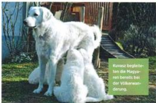
Kuvasz begleiten die Magyaren bereits bei der Völkerwanderung.