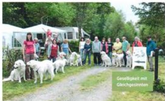
Geselligkeit mit Gleichgesinnten