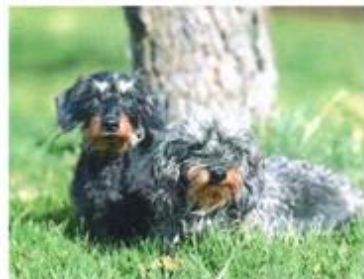
Graue Schnauzen – Seite 28