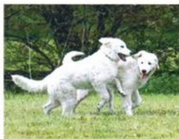
Kuvasz-Vereinigung Deutschland e.V. – Seite 6