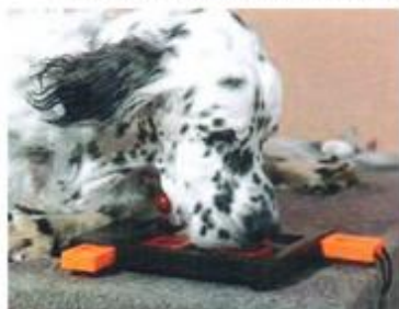
Strategiespiele für Hunde – Seite 18