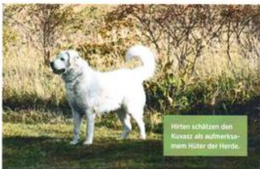
Hirten schätzen den Kuvasz als aufmerksamem Hüter der Herde.