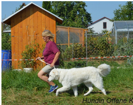
Hündin Offene Klasse