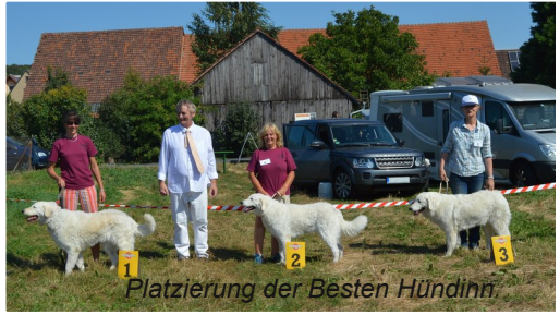
Platzierung der Besten Hündin