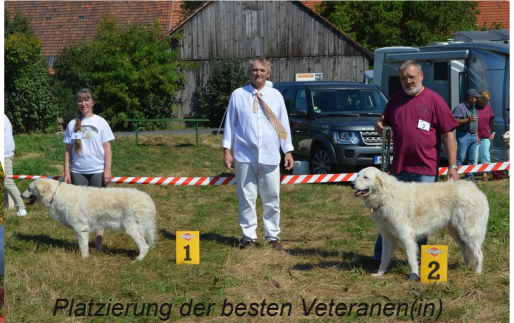
Platzierung der besten Veteranen(in)