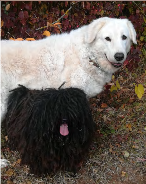
Edelény Kerti Írisz mit stolzen 12 Jahren; Stammhündin der Zuchtstätte Mézeshegyi