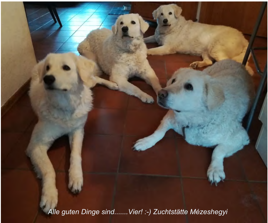
Alle guten Dinge sind.....Vier! :-) Zuchtstätte Mézeshegyi